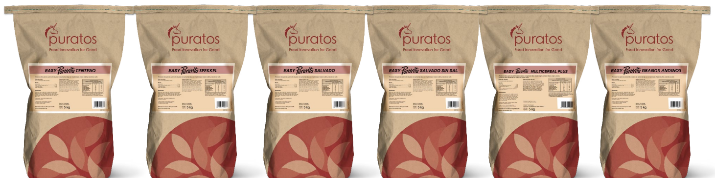
Easy Puravita Centeno

Podes combinar O-tentic con nuestra línea de premezclas Puravita para obtener panes rústicos con todo lo bueno de los granos y semillas.