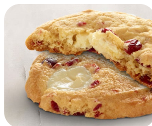
Cookies de frambuesa y Carat Decorcrem Blanco