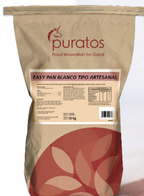
Easy Pan Blanco Tipo Artesanal

Animáte a ofrecer un producto 100% en tendencia