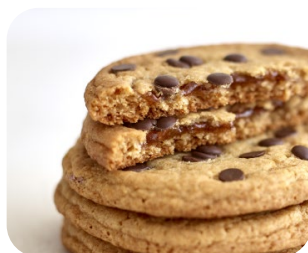
Cookies con chips de chocolate y rellenas de Vivafil Frambuesa