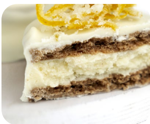
Carat Decorcrem Limón