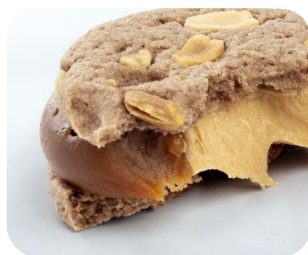
Dulce de Leche Puratos y corazón de Supercrem Maní