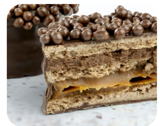
Carat Supercrem Avellanas y Dulce de Leche Puratos