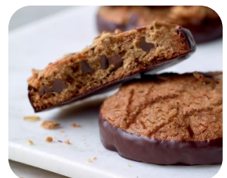
Cookies Premium con Belcolade Semiamargo