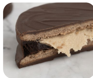
Carat Ganache Semiamargo y corazón de Supercrem Maní