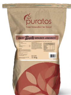
Easy Puravita Granos Andinos