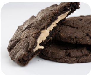
Cookies rellenas con Supercrem Maní